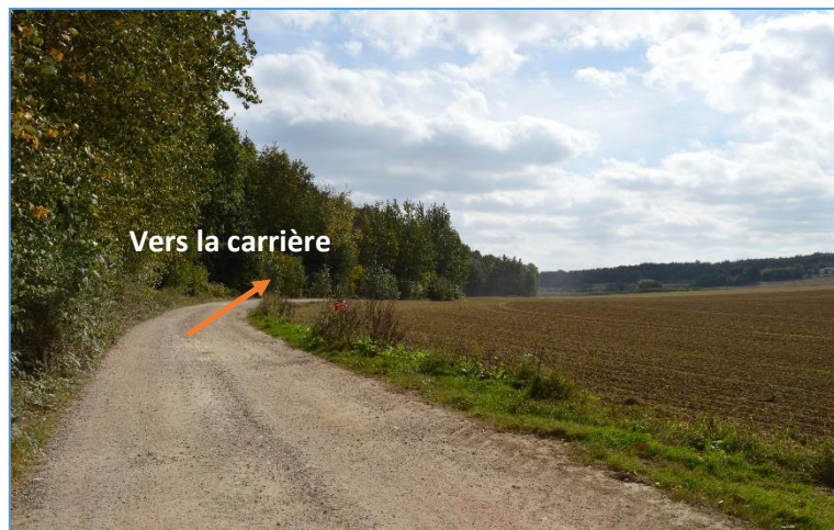
Fig. 13 : Vue n°2 sur la carrière depuis la voie privée