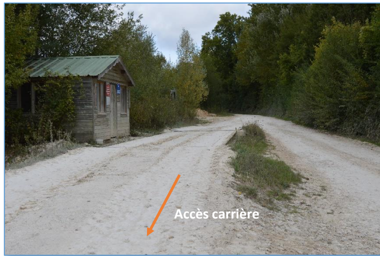
Fig. 12 : Vue n°1 sur l'entrée de la carrière